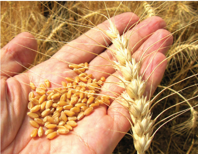
شکل ۲- دانه و سنبله گندم ریژاو